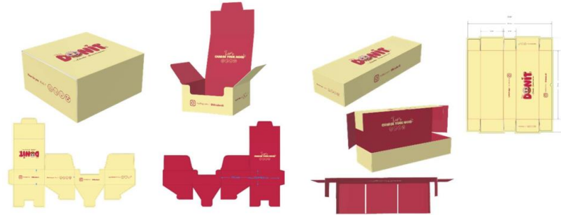
Gambar 4: Mockup Packaging (kemasan donat)

Implementasi brand identity dilakukan pada berbagai media seperti kemasan produk dan media promosi digital. Penerapan desain pada kemasan bertujuan untuk meningkatkan daya tarik visual sekaligus memperkuat identitas merek. Kemasan yang konsisten dengan brand identity mampu menciptakan pengalaman visual yang lebih kuat bagi konsumen. Hal ini juga meningkatkan nilai estetika produk secara keseluruhan.