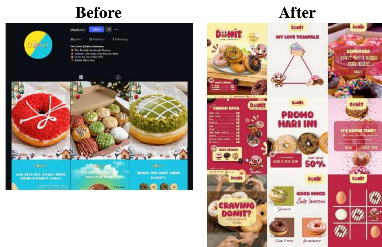
Gambar 5: Before–After Feed Instagram This Donit

Implementasi pada media digital seperti Instagram menunjukkan perubahan signifikan dalam tampilan visual brand. Konten yang lebih terstruktur dan konsisten mampu meningkatkan daya tarik visual. Hal ini sejalan dengan karakter target audiens yang cenderung responsif terhadap visual yang menarik. Dengan demikian, penerapan manual branding memberikan dampak langsung terhadap kualitas komunikasi digital.