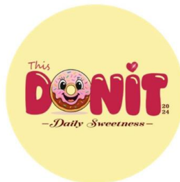
Gambar 3: Logo Utama

Brand identity yang telah dirancang kemudian disusun dalam bentuk manual branding sebagai panduan penggunaan identitas merek. Manual branding ini mencakup aturan penggunaan logo, warna, tipografi, serta elemen visual lainnya. Dokumen ini berfungsi sebagai standar yang memastikan konsistensi dalam setiap aktivitas komunikasi visual. Dengan adanya panduan ini, penggunaan identitas merek menjadi lebih terarah dan sistematis.