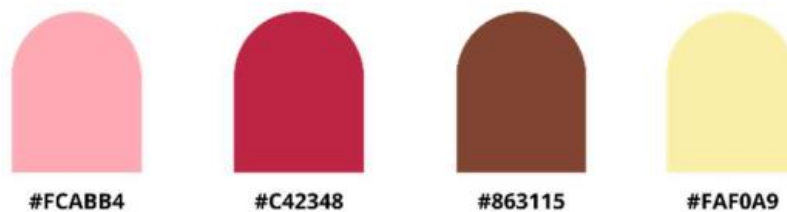
Gambar 2: Palet Warna

Penggunaan warna dalam brand identity menjadi aspek penting dalam membangun persepsi emosional konsumen. Warna pink dan kuning dipilih karena mampu menciptakan kesan manis, ceria, dan menggugah selera. Warna coklat digunakan sebagai penyeimbang untuk memberikan kesan hangat dan natural. Pemilihan warna ini sejalan dengan teori warna yang menyatakan bahwa warna memiliki pengaruh psikologis terhadap perilaku konsumen.