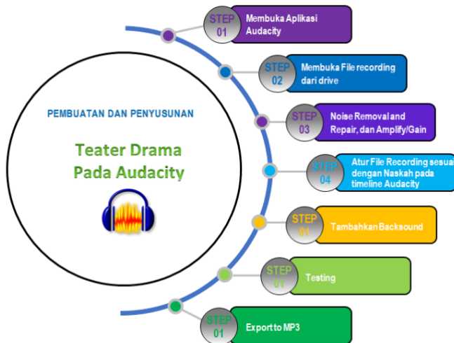
Gambar 3. Alur pembuatan teater drama menggunakan Audacity

Dalam hal ini penggunaan Aplikasi Audacity ini yakni digunakan untuk kebutuhan pembuatan teater drama dalam pementasan. Adapun alur dalam pembuatan teater drama dengan memanfaatkan aplikasi ini seperti yang tergambar pada alur dibawah ini.