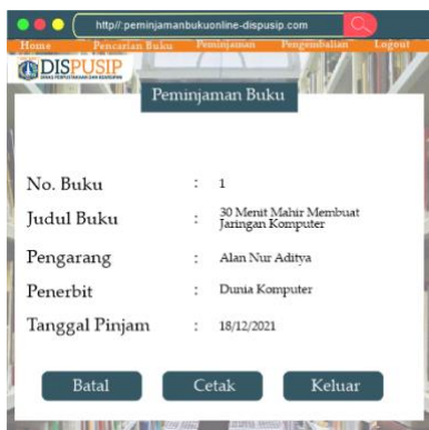
Gambar 8. Tampilan Peminjaman Buku

Menu ke empat adalah peminjaman buku dimana pemustakan sudah meminjam buku. Pada menu peminjaman ini tertera No. Buku, judul buku yang dipinjam, nama pengarang dari buku yang dipinjam, penerbit dan tanggal peminjaman