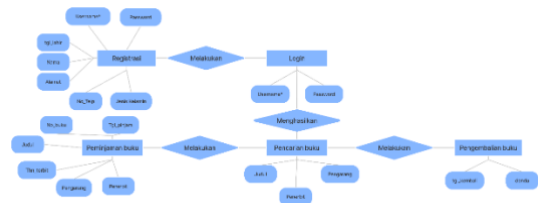
Gambar 4. ERD Diagram Sistem Peminjaman Buku