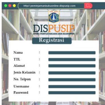
Gambar 6. Tampilan Registrasi

Menu ketiga adalah tampilan pencarian buku yang dimana pemustaka dapat mencari buku sesuai pada nomer, judul buku, pengarang, dan penerbit.