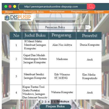
Gambar 7. Tampilan Pencarian Buku

Menu ketiga adalah tampilan pencarian buku yang dimana pemustaka dapat mencari buku sesuai pada nomer, judul buku, pengarang, dan penerbit.