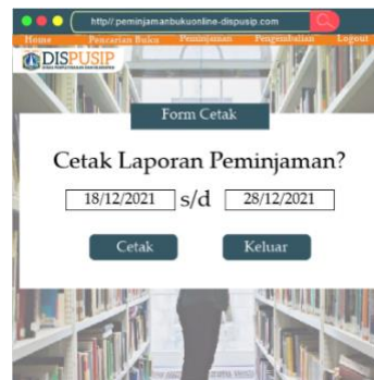
Gambar 9. Tampilan Form Cetak Peminjaman

Menu ke lima adalah form cetak peminjaman sebagai bahan bukti pemustakan meminjam buku. Pada menu ini berisi tentang tanggal peminjaman buku dan tanggal pengembalian buku.