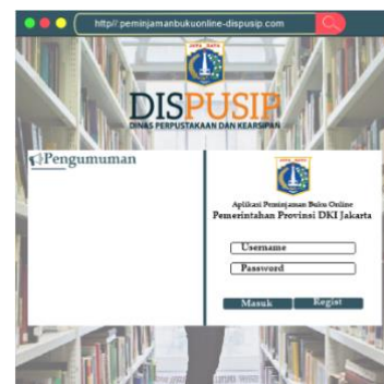
Gambar 5. Tampilan Login

Menu pertama adalah menu login merupakan menu merupakan menu yang tampil saat awal di akses oleh pemustaka. Pada menu login menampilkan menu seperti Username, Password.