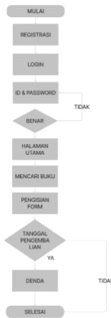
Gambar 2. Flowchart pemustaka