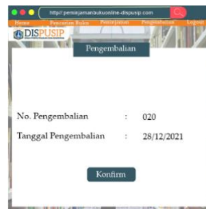
Gambar 10. Tampilan Pengembalian

Menu ke enam adalah menu pengembalian buku pemustaka. Pada menu ini pemustaka harus melaporkan kepada staff untuk pengembalian buku.